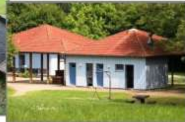
Sanitär- und Küchenhaus