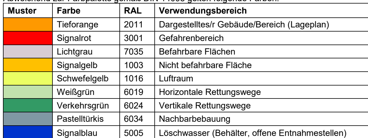
Tabelle 1: Farbgestaltung

Abweichend zur Farbpalette gemäß DIN 14095 gelten folgende Farben: